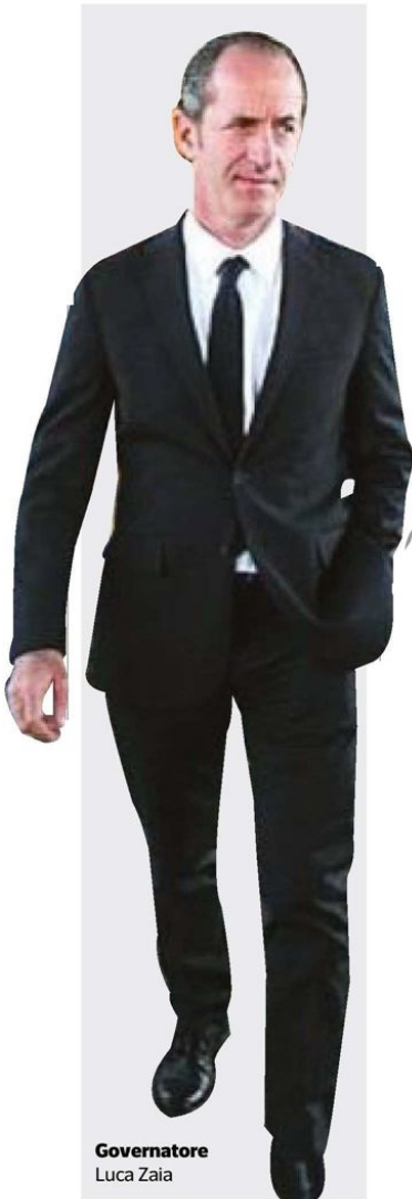
Governatore Luca Zaia

Nel settembre 2019 il Comitato olimpico internazionale (Cio) dovrà scegliere la sede dei Giochi invernali del 2026. Entro oggi, quindi, i Paesi membri dovevano raccogliere le manifestazioni di interesse delle singole località