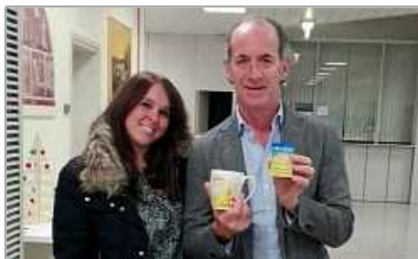
Natale a Conegliano, consegnata la tazza solidale al governatore della Regione Veneto