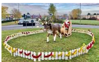
Conegliano, rotonde senza addobbi a causa della burocrazia. Marcon: un