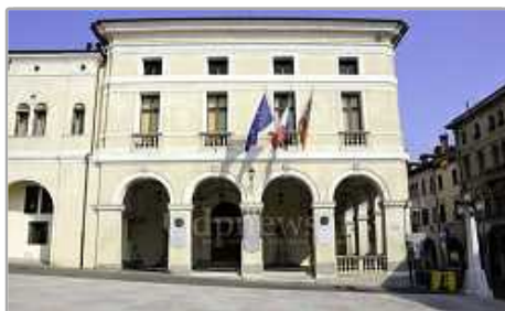
Questa sera consiglio comunale a Conegliano: dodici punti all'ordine del giorno