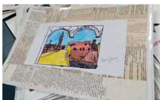
Casa Fenzi e Piccola Comunità, realizzate 400 tovaglette per i pasti con Riceriamo